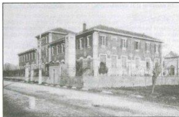
Figura 1: Sede iniziale della Casa di Riposo Molina. Veduta Generale del fabbricato sede del Pensionato Femminile

Con una deliberazione consiliare del 1996, l'Ente fu denominato "Istituto Geriatrico Fratelli Paolo e Tito Molina" più rispondente alla caratterizzazione allora assunta.